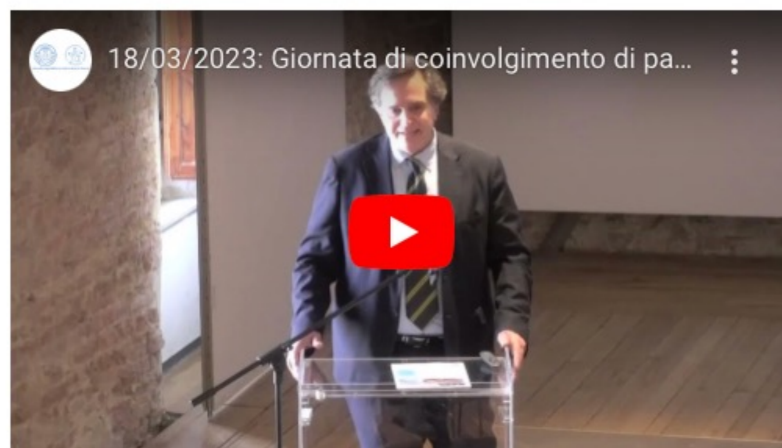
Video integrale dell'evento